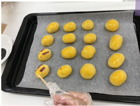
さつまいもの皮で耳を作りました！